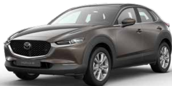
TITANIUM FLASH MICA € 800