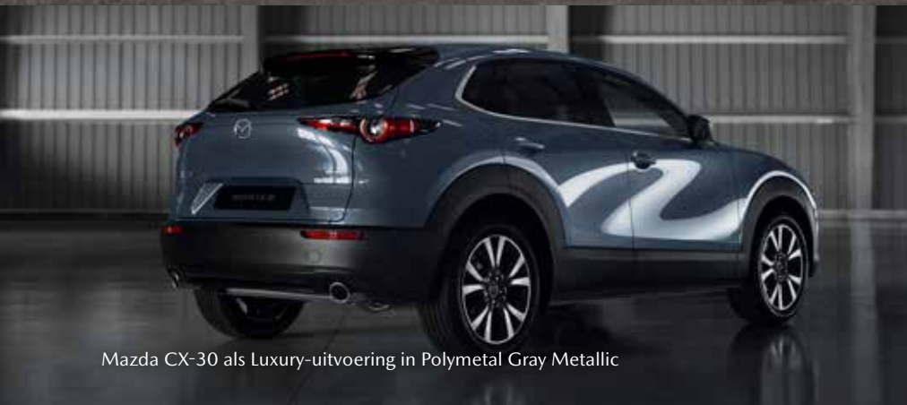
Mazda CX-30 als Luxury-uitvoering in Polymetal Gray Metallic