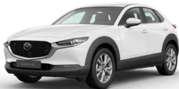
ARCTIC WHITE SOLID

Je hebt keuze uit negen kleuren. Arctic White Solid vormt de basis. Machine Gray Metallic en Soul Red Crystal Metallic zijn het meest exclusief. Een speciale laktechniek met nog kleinere en heldere aluminiumdeeltjes zorgt voor een ongekend diepe, heldere kleur.