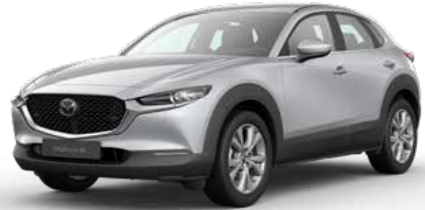
SONIC SILVER METALLIC € 800