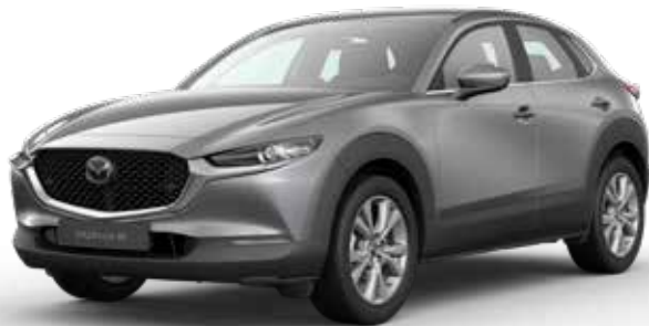
MACHINE GRAY METALLIC € 1.000