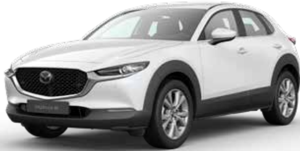
SNOWFLAKE WHITE PEARL € 800