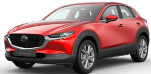
SOUL RED CRYSTAL METALLIC € 1.150