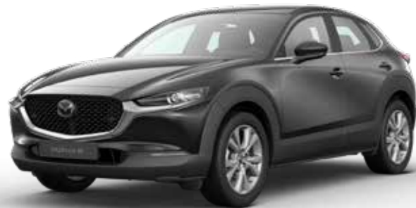
JET BLACK MICA € 800