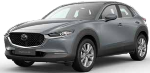
POLYMETAL GRAY METALLIC € 800