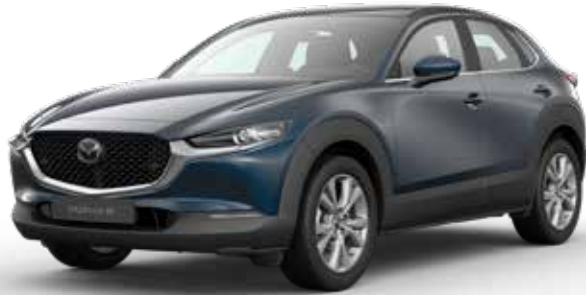
DEEP CRYSTAL BLUE MICA € 800