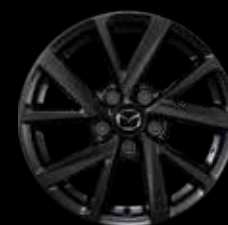
16" Lichtmetalen velgen Palladium, design 71A

Setprijzen incl. BTW, incl. TPMS-sensoren, excl. banden. Bandenprijzen kun je opvragen bij je Mazda dealer.