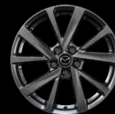
18" Lichtmetalen velgen Chrome Shadow, design 72