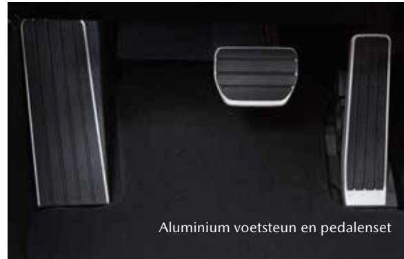
Aluminium voetsteun en pedalenset