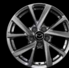
16" Lichtmetalen velgen Silver, design 71