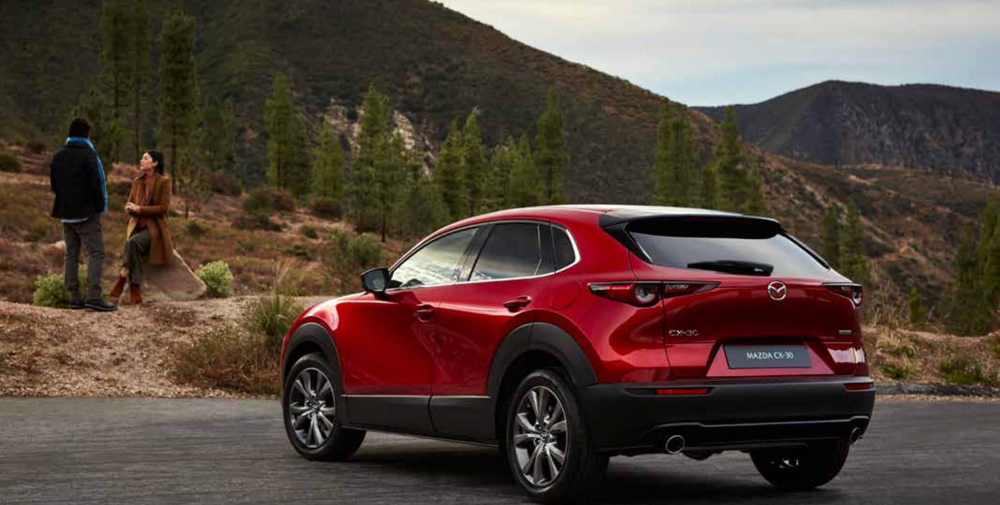
Mazda CX-30 als Luxury-uitvoering in Soul Red Crystal (velg in Bright Silver is van toepassing bij Skyactiv-X)