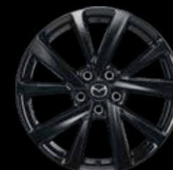
18" Lichtmetalen velgen Black Glossy, design 72A