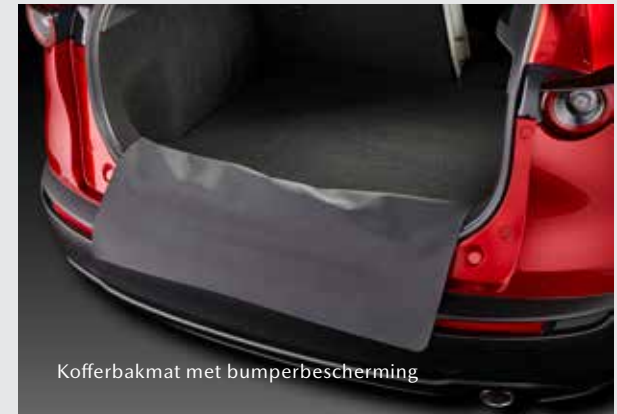
Kofferbakmat met bumperbescherming