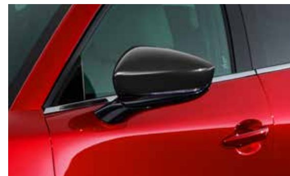
Spiegelkappen Uitgevoerd in Brilliant Black.