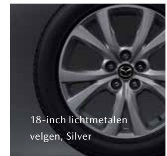
18-inch lichtmetalen velgen, Silver