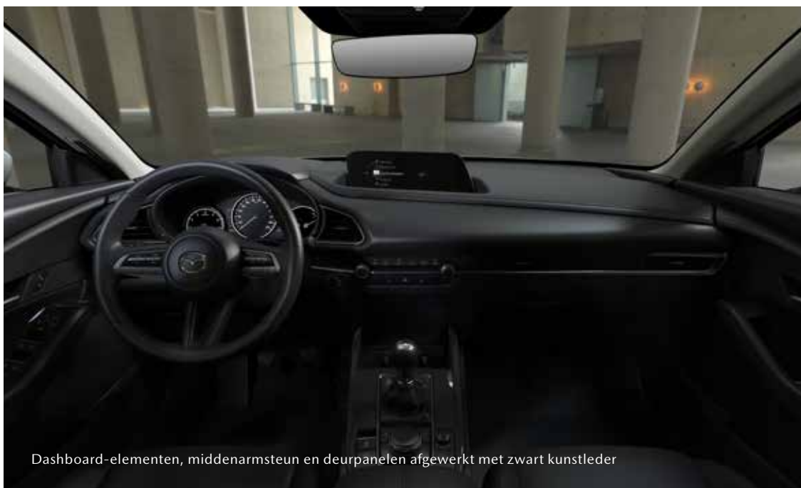
Dashboard-elementen, middenarmsteun en deurpanelen afgewerkt met zwart kunstleder