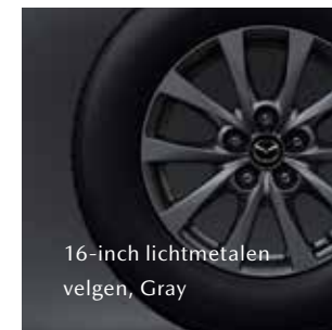
16-inch lichtmetalen velgen, Gray