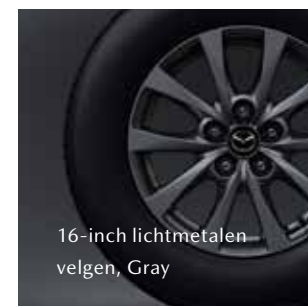
16-inch lichtmetalen velgen, Gray