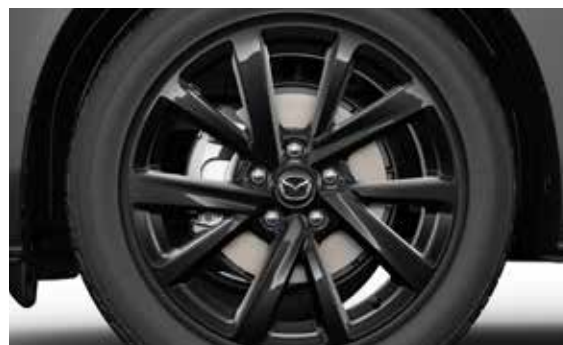
18" lichtmetalen velgen Black Glossy Design 72A, 7J x 18. Geadviseerde bandenmaat: 215/50 R18.