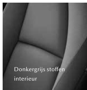
Donkergrijs stoffen interieur