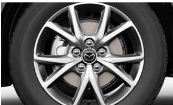
17" lichtmetalen velgen Hyper Gun Design 73, 6.5J x 17. Geadviseerde bandenmaat: 215/60 R17 96H.