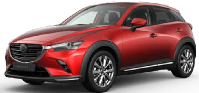
SOUL RED CRYSTAL METALLIC € 1.000