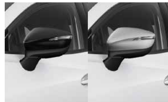
Spiegelkappen Keuze uit Brilliant Black of Bright Silver.