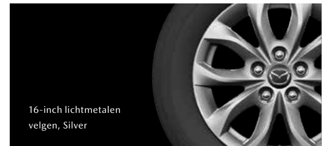
16-inch lichtmetalen velgen, Silver