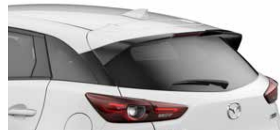
Dakspoiler Uitgevoerd in Brilliant Black.