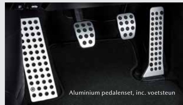
Aluminium pedalenset, incl. voetsteun