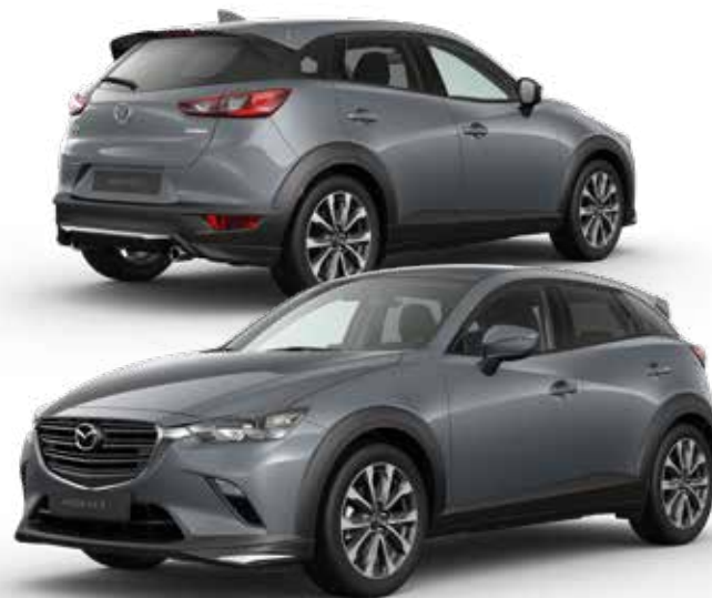
Mazda CX-3 met Sport pakket