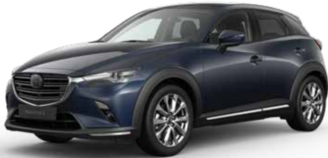
DEEP CRYSTAL BLUE MICA € 650