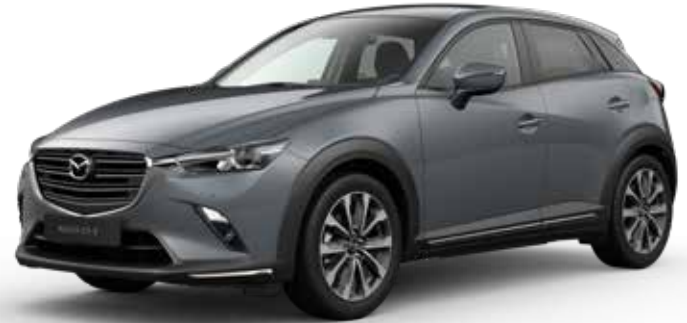
POLYMETAL GRAY METALLIC* € 650