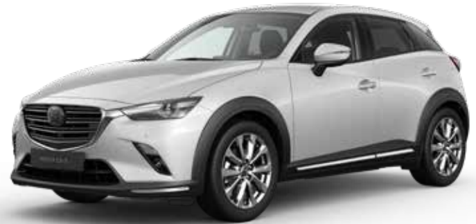
CERAMIC METALLIC € 650