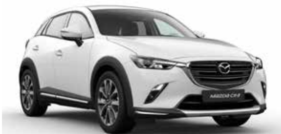
Skidplate t.b.v. voorzijde Uitgevoerd in zilverkleur.