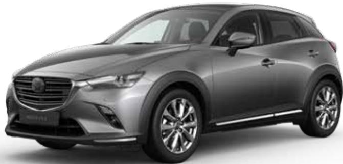
MACHINE GRAY METALLIC € 850