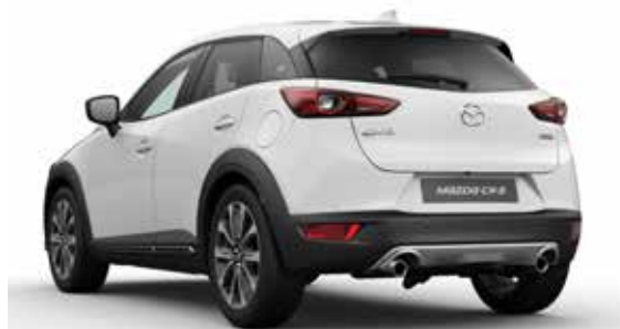
Skidplate t.b.v. achterzijde Uitgevoerd in zilverkleur.