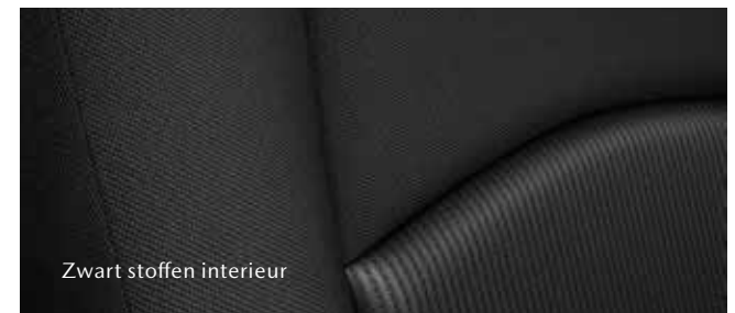
Zwart stoffen interieur