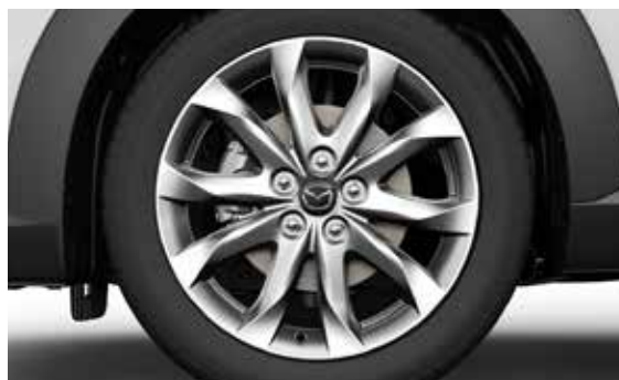
18" lichtmetalen velgen Silver Design 152, 7J x 18. Geadviseerde bandenmaat: 215/50 R18.