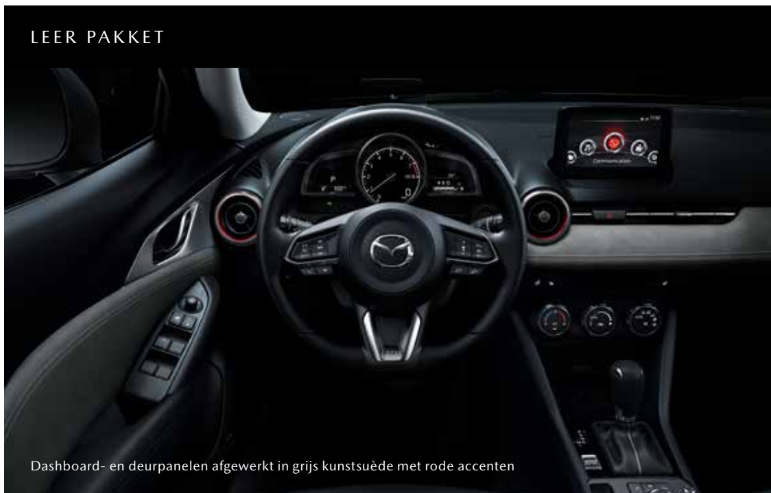
Dashboard- en deurpanelen afgewerkt in grijs kunstsuède met rode accenten