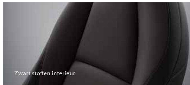
Zwart stoffen interieur