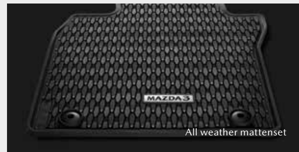
All weather mattenset