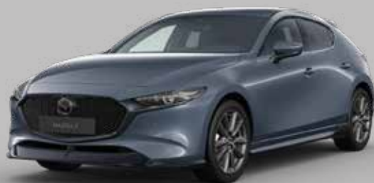
Mazda3 met Sport Pakket

SPORT PAKKET Geschikt voor alle Mazda3 Hatchback-uitvoeringen