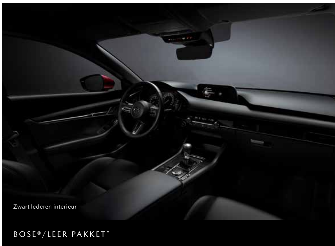
Zwart lederen interieur