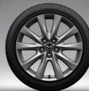
18-inch lichtmetalen velgen, Silver