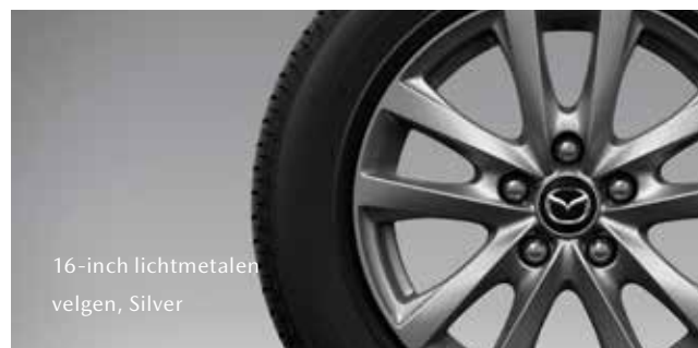
16-inch lichtmetalen velgen, Silver