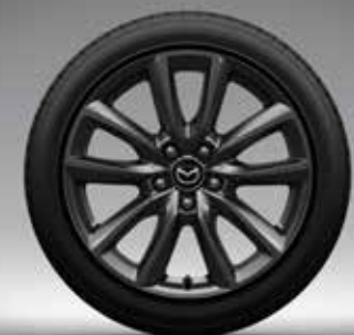
18-inch lichtmetalen velgen, Gray