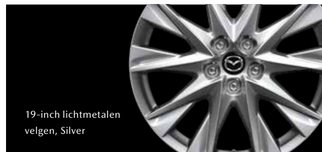
19-inch lichtmetalen velgen, Silver