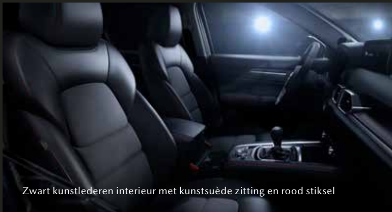
Zwart kunstlederen interieur met kunstsuède zitting en rood stiksel