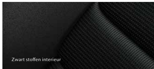
Zwart stoffen interieur