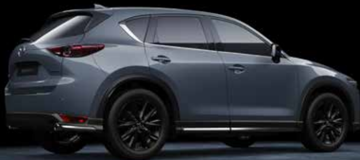
Mazda CX-5 Sportive met Sport Pakket

SPORT PAKKET Geschikt voor alle Mazda CX-5-uitvoeringen