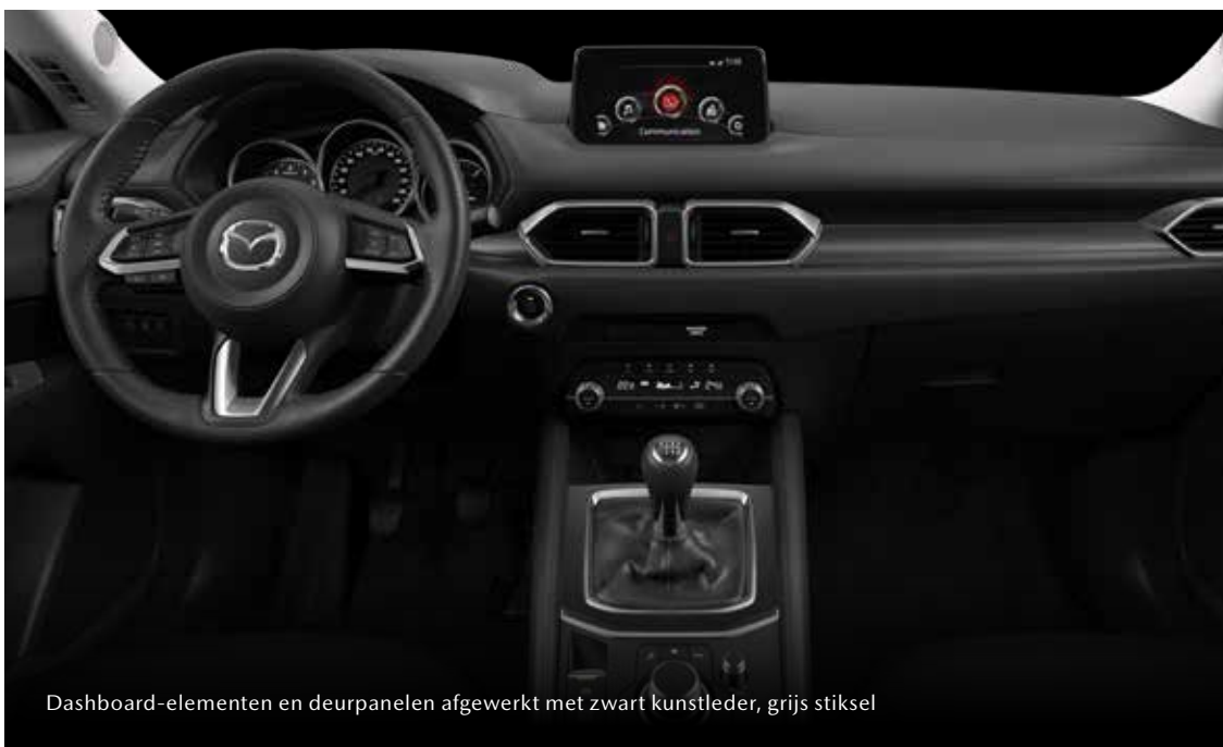
Dashboard-elementen en deurpanelen afgewerkt met zwart kunstleder, grijs stiksel