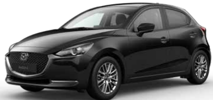
JET BLACK MICA