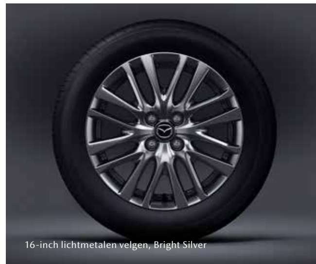
16-inch lichtmetalen velgen, Bright Silver