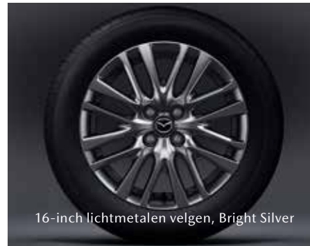
16-inch lichtmetalen velgen, Bright Silver