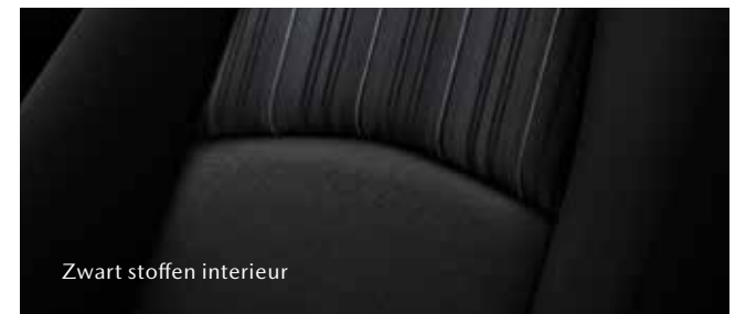
Zwart stoffen interieur