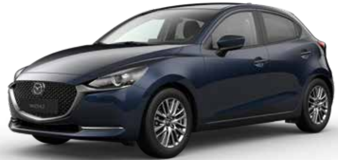
DEEP CRYSTAL BLUE MICA