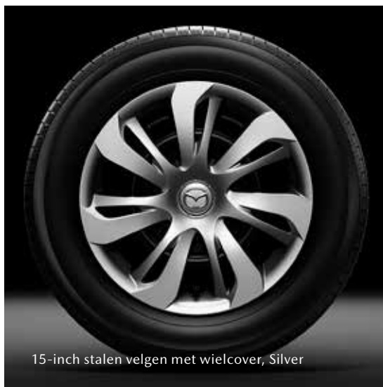
15-inch stalen velgen met wielcover, Silver