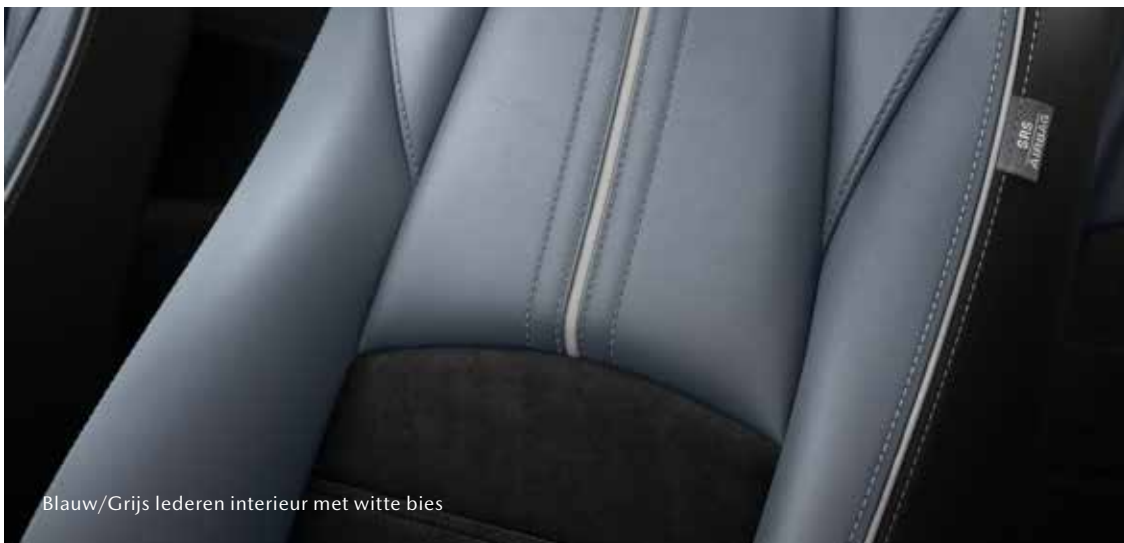
Blauw/Grijs lederen interieur met witte bias