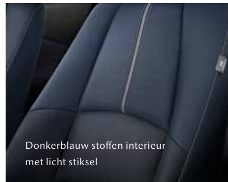
Donkerblauw stoffen interieur met licht stiksel