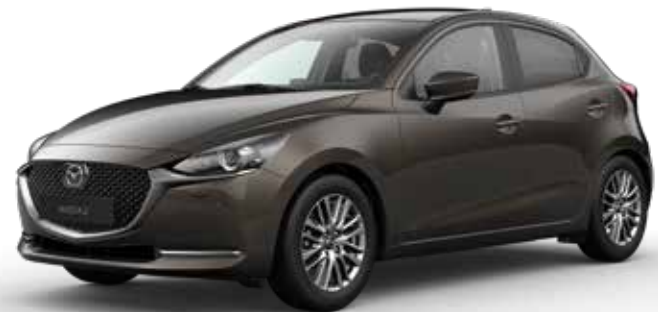
TITANIUM FLASH MICA