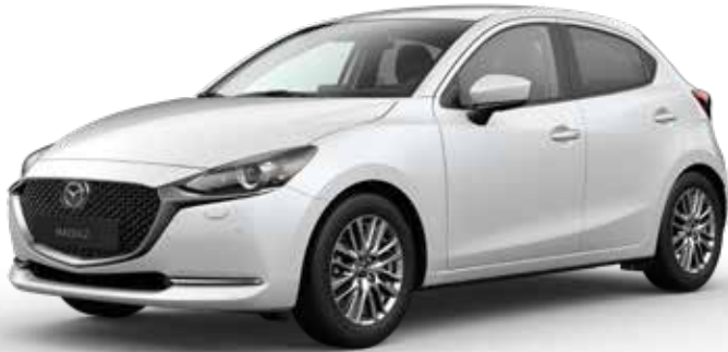
SNOWFLAKE WHITE PEARL