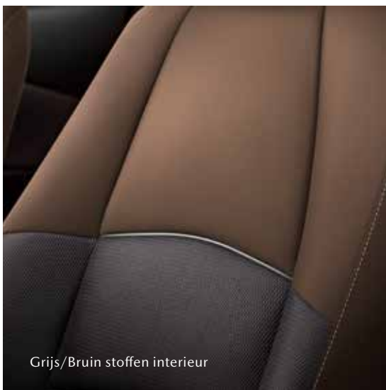
Grijs/Bruin stoffen interieur