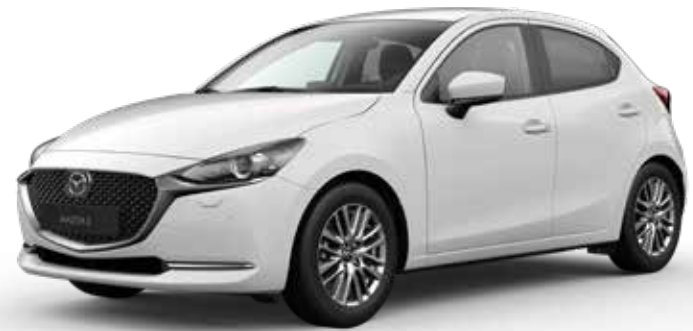
ARTIC WHITE SOLID