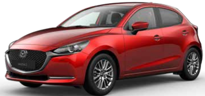
SOUL RED CRYSTAL METALLIC