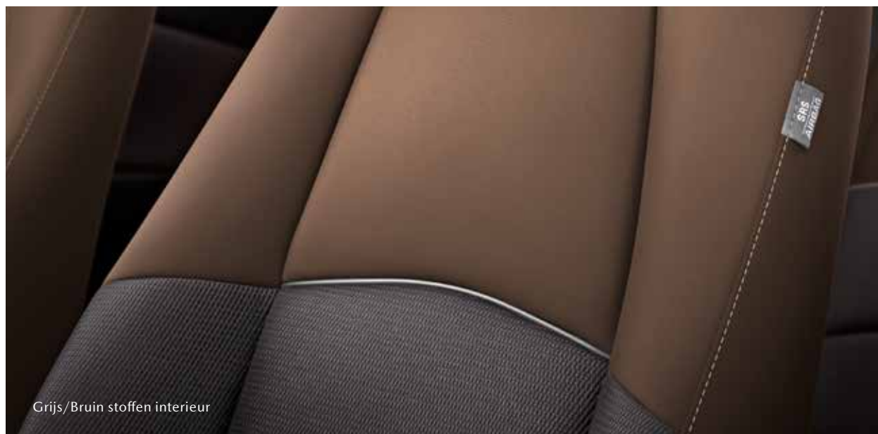
Grijs/Bruin stoffen interieur

De Mazda2 is helemaal bij de tijd. Vanbinnen en vanbuiten. En dat maakt 'm in alle opzichten verfijnd. Verrassend verfijnd. Op zoek naar een extra stijlvolle auto? Dan is de Mazda2 Style Selected de ideale keuze. Deze speciale uitvoering combineert de rijke uitrusting van de Comfort-uitvoering met extra elementen en een stijlvolle uitstraling.