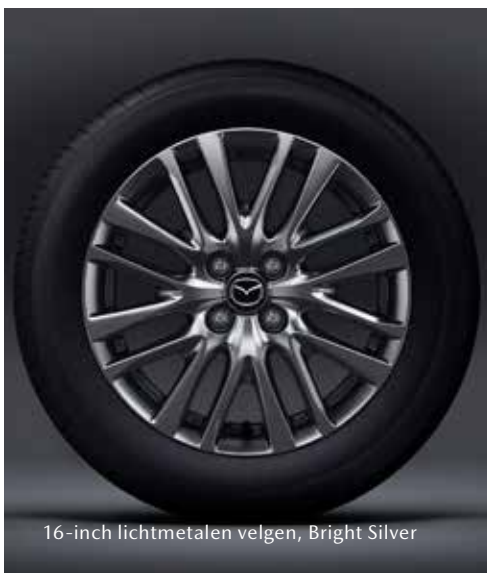
16-inch lichtmetalen velgen, Bright Silver