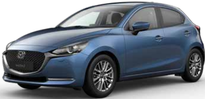
ETERNAL BLUE MICA