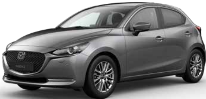
MACHINE GRAY METALLIC