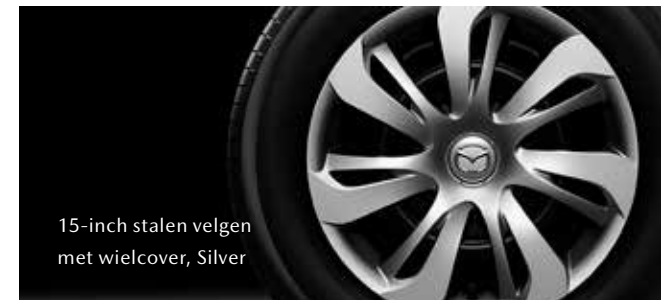
15-inch stalen velgen met wielcover, Silver