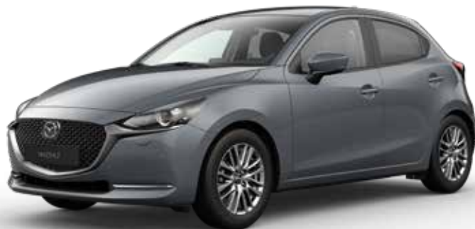
POLYMETAL GRAY METALLIC