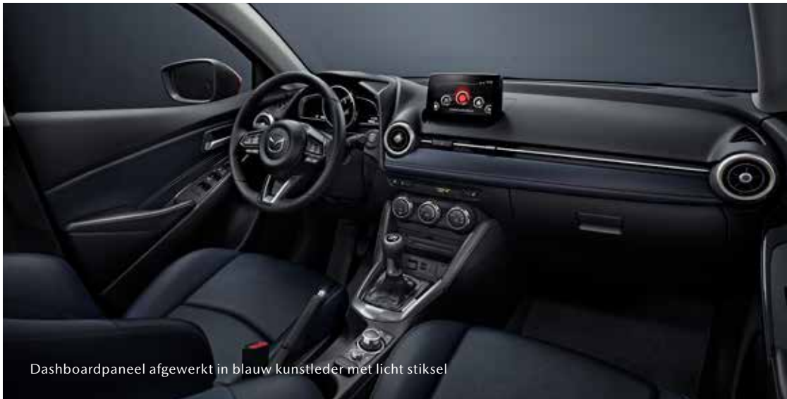
Dashboardpaneel afgewerkt in blauw kunstleder met licht stiksel