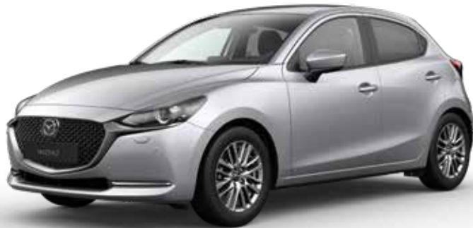
SONIC SILVER METALLIC